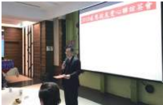
李校長清吟致詞 李校長清吟致詞