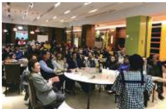
表演藝術系精彩表演表演藝術系精彩表演