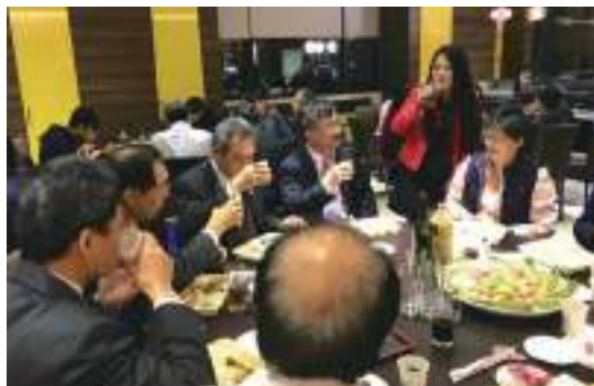
校友與受惠學生於R A T A餐敘合影