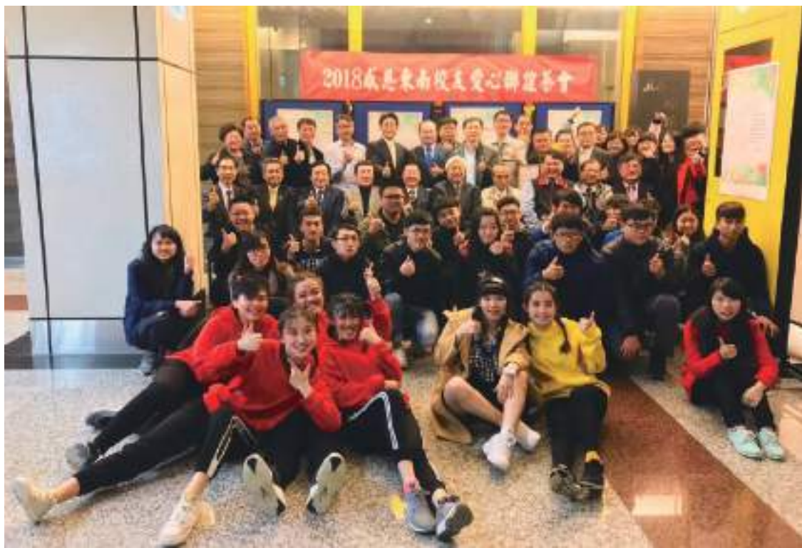
林執行董事、李校長與校友、師長、學生們大合照

致贈感謝狀後，由林常務董事守義及李校長帶領師長及學生們與校友們大合照留影。會後邀請校友及受贈學生們一起用餐，並於用餐時受贈學生將自己寫好的感謝卡片交給學長姐並與學長姐進行相互交流，透過相見歡活動讓校友們與學生互動，增加彼此的連結，也提供學生機會表達對學長姐們的感謝，也為活動劃下了完美的句點。