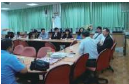
土木營建系友會獎助學金審查開會

感謝校友及企業界一年來對土木營建系友會之鼎力支持，協助辦理各項活動及捐款善舉。每學期贊助學生暑期實習及頒發「土木營建系優良學生獎學金」，並藉此活動加強校友及業界聯誼。