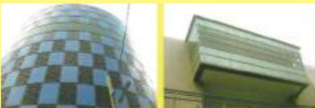
圓形玻璃帷幕牆及沖孔板