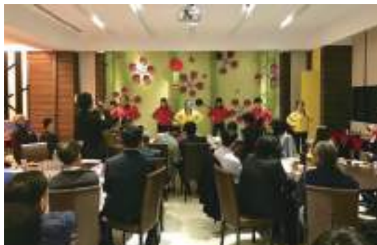
表演藝術系學生精彩表演表演藝術系精彩表演