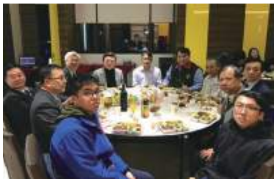
校友與受惠學生於R A T A餐敘合影